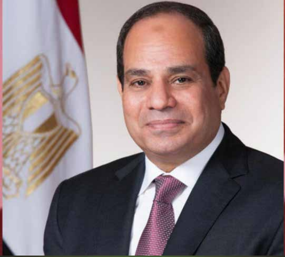
فخامة رئيس الجمهورية عبد الفتاح السيسي